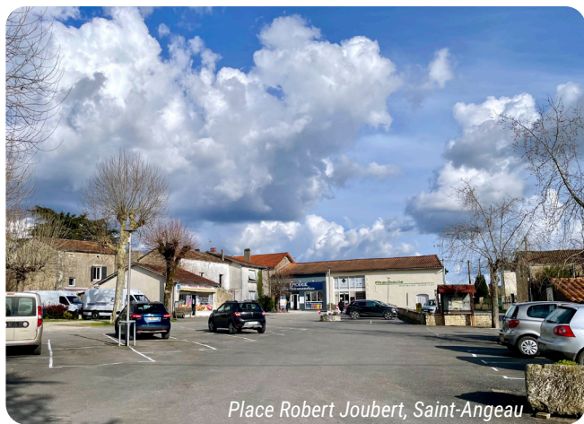
Place Robert Joubert, Saint-Angeau