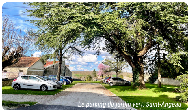
Le parking du jardin vert, Saint-Angeau

Date limite de réponse : lundi 14 avril 2025.