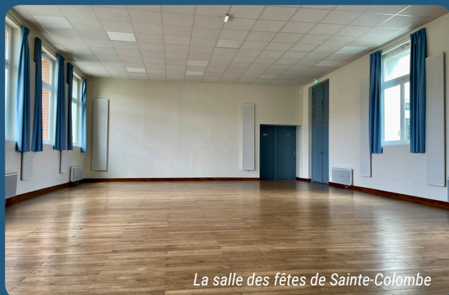
La salle des fêtes de Sainte-Colombe