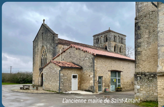
L'ancienne mairie de Saint-Amant